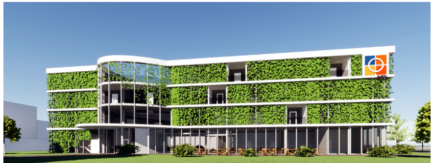
Entwurf für das neue Haus (©Susanne Braun | Architektin, Planungsgruppe Augsburg)

Wir glauben, dass wir in Augsburg einen Ort der Begegnung für Menschen in der letzten Lebensphase brauchen, für ihre Angehörigen und für die, die sich um sie kümmern – und kümmern